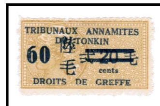
60 on 20 cents